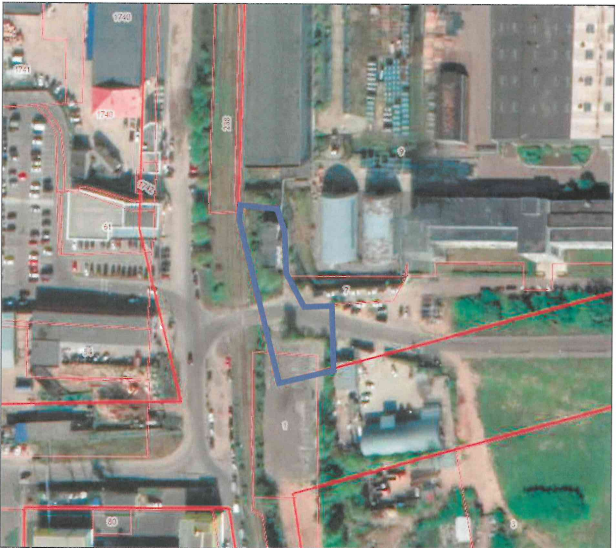
Схема границ подготовки документации по планировке территории