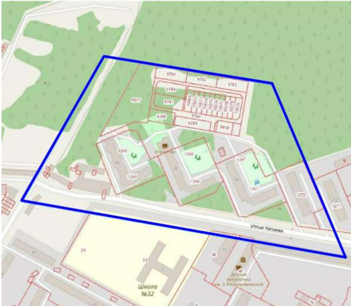
Схема границ подготовки документации по планировке территории