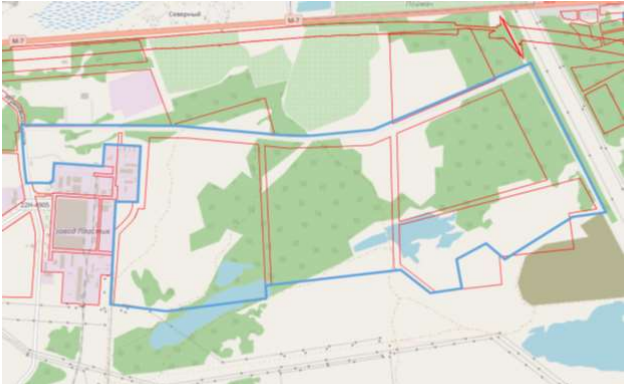
Схема границ подготовки документации по планировке территории