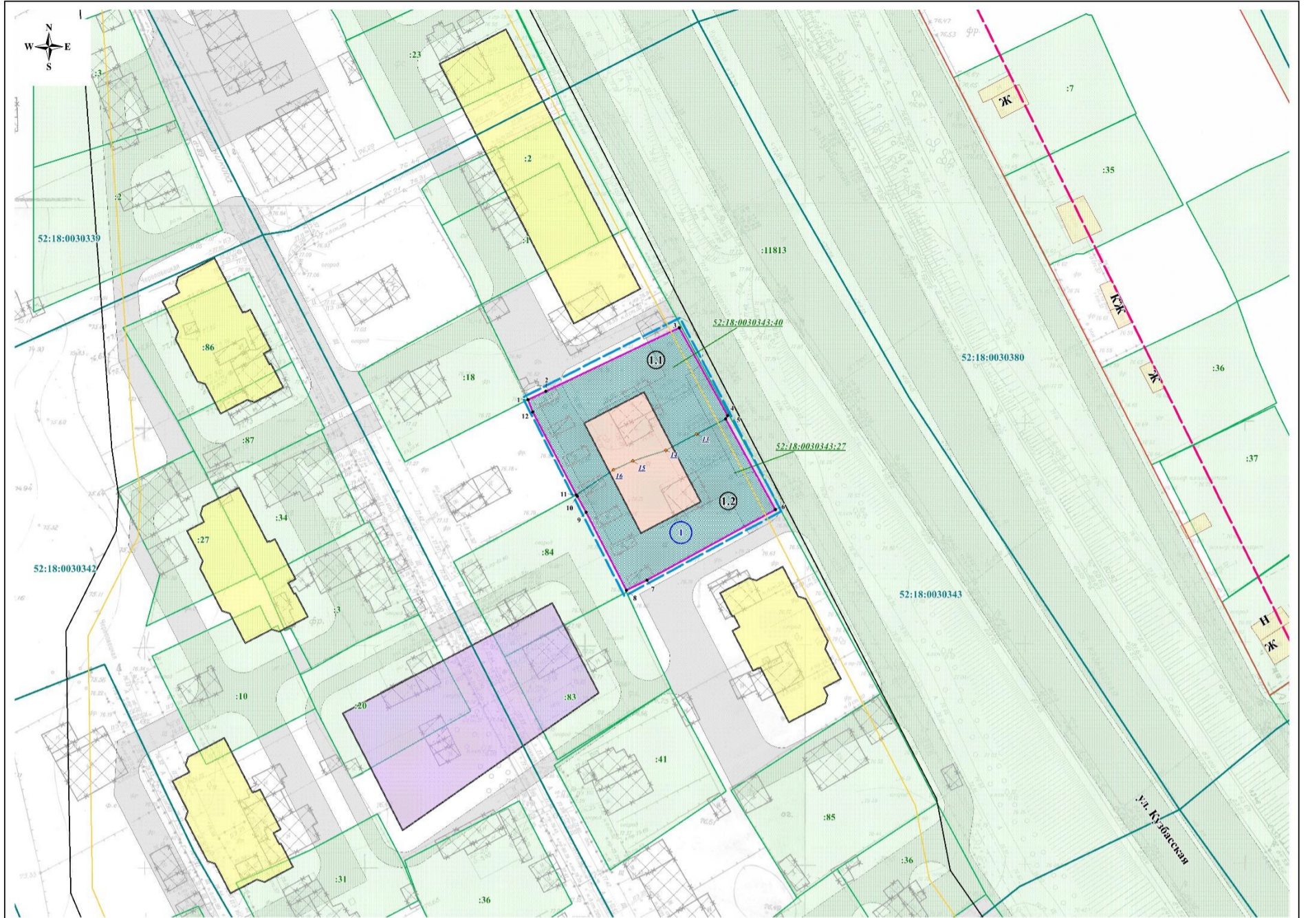
Экспликация образуемых и изменяемых земельных участков на кадастровом плане территории