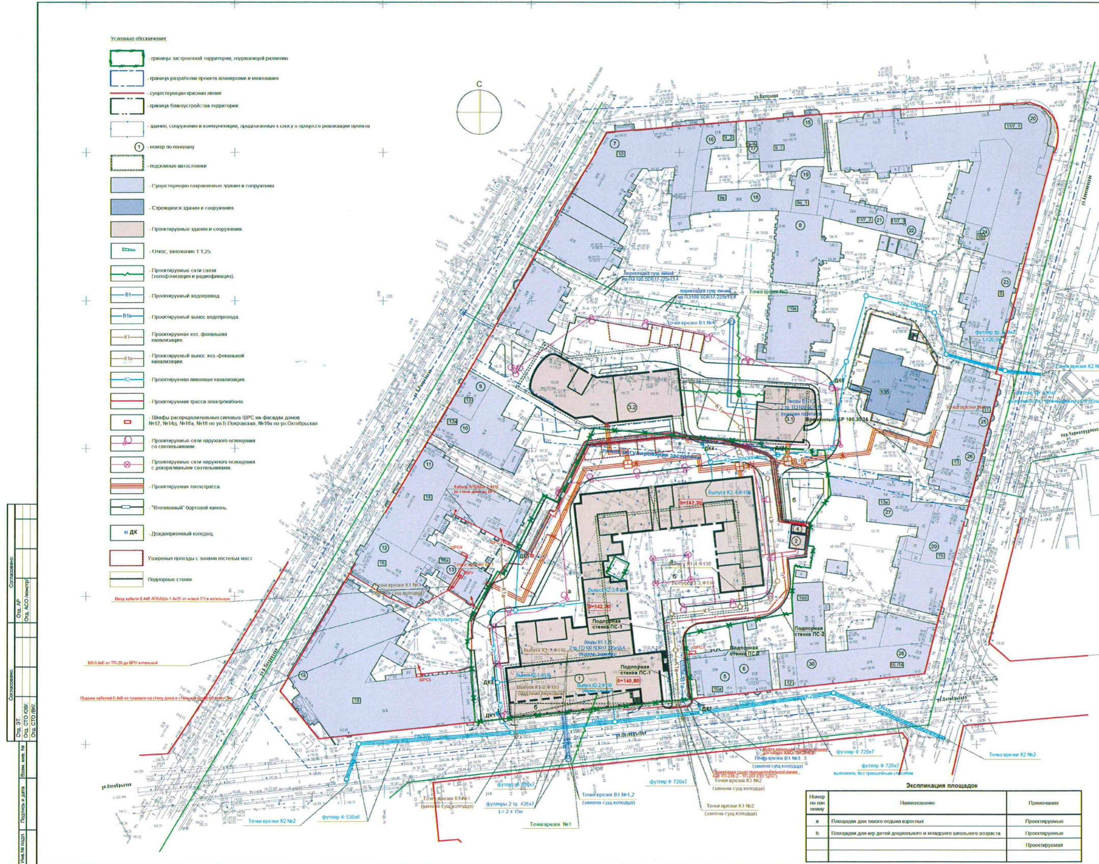
Экспликация зданий с сооружениями