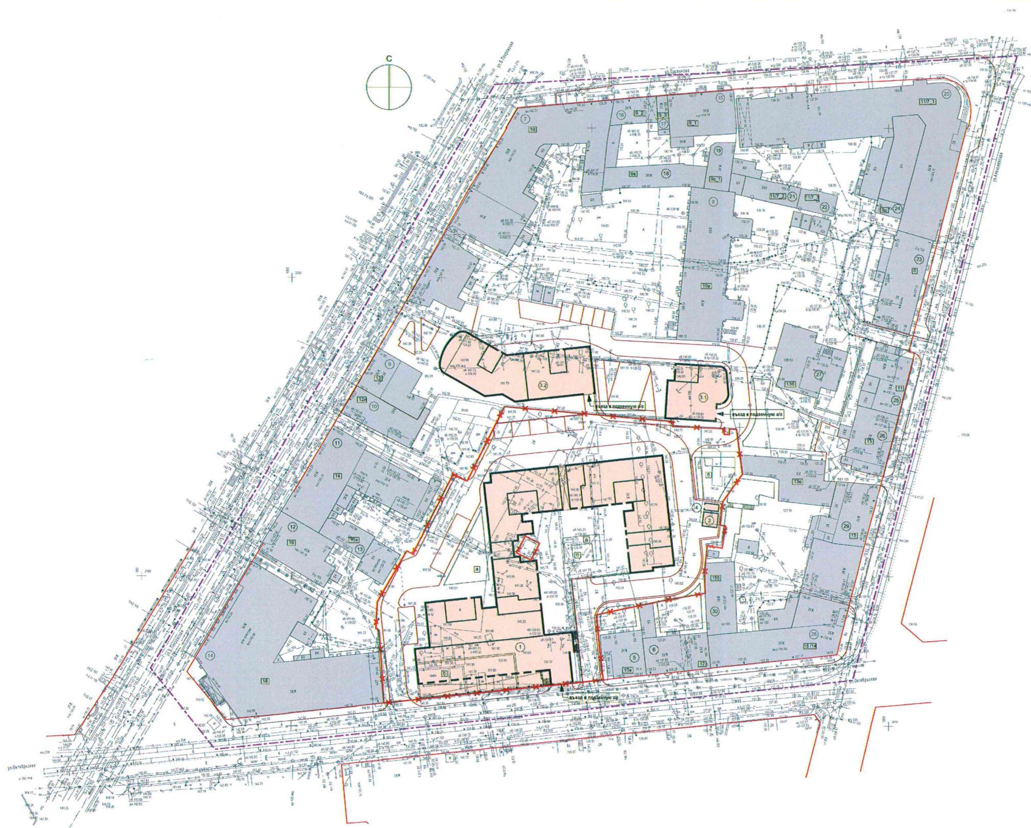
Засвидетельствование данных, строений и сооружений