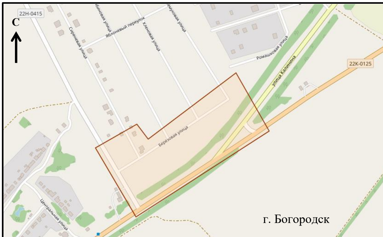
Схема границ подготовки проекта планировки территории (арх. № 32/22)