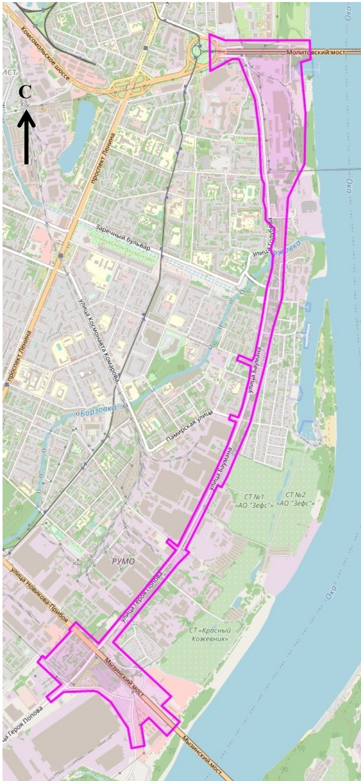
Схема границ подготовки документации по планировке территории (арх. № 52/22)