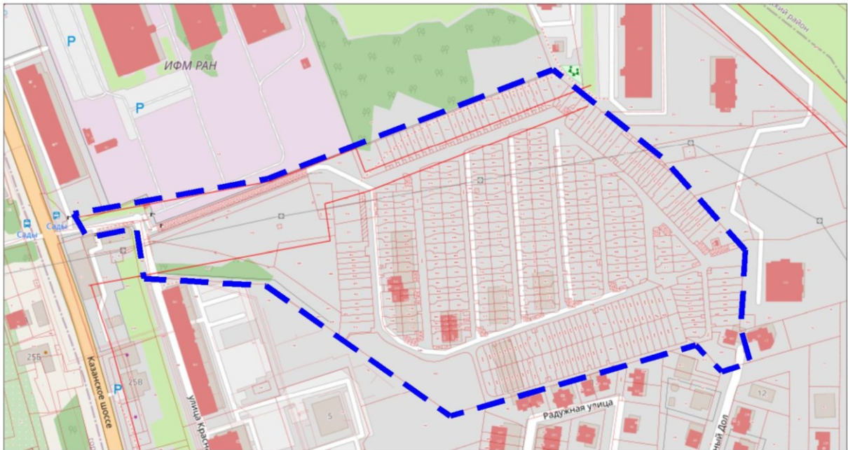
Схема границ подготовки документации по планировке территории