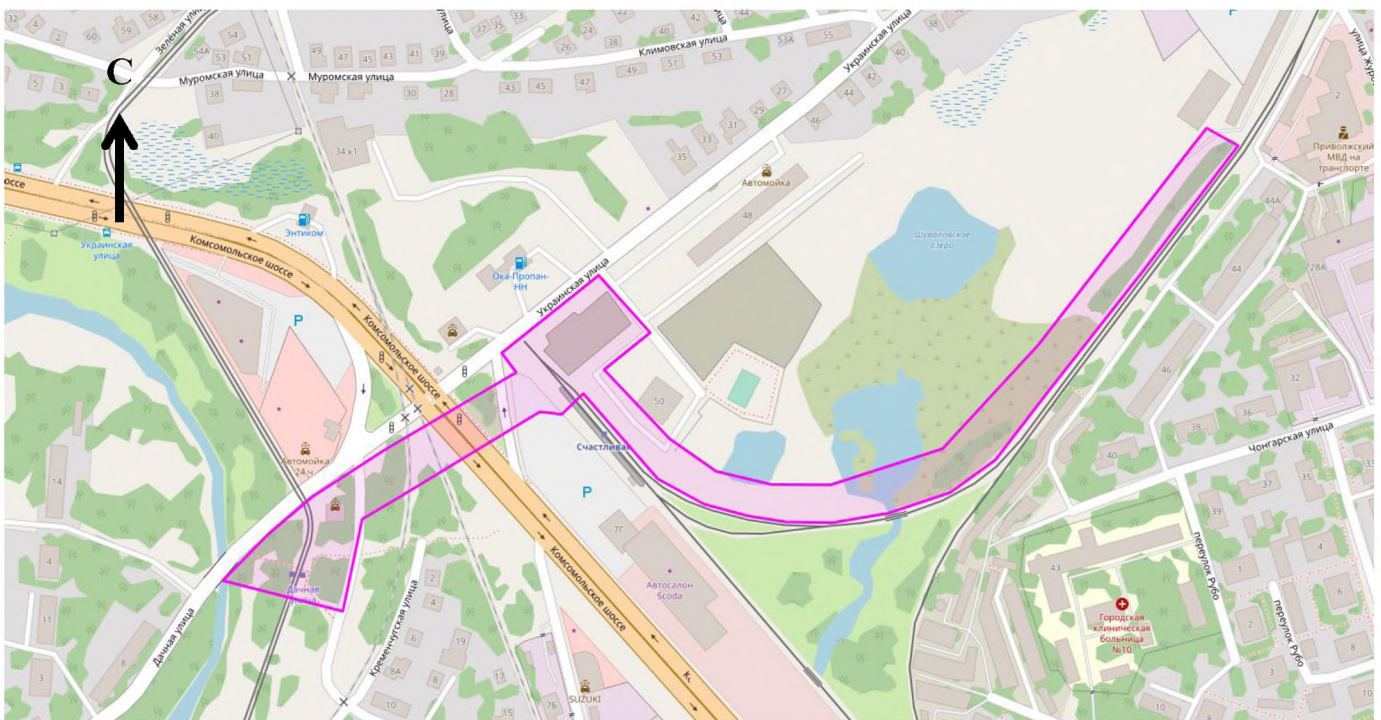
Схема границ подготовки документации по планировке территории (арх. № 85/22)