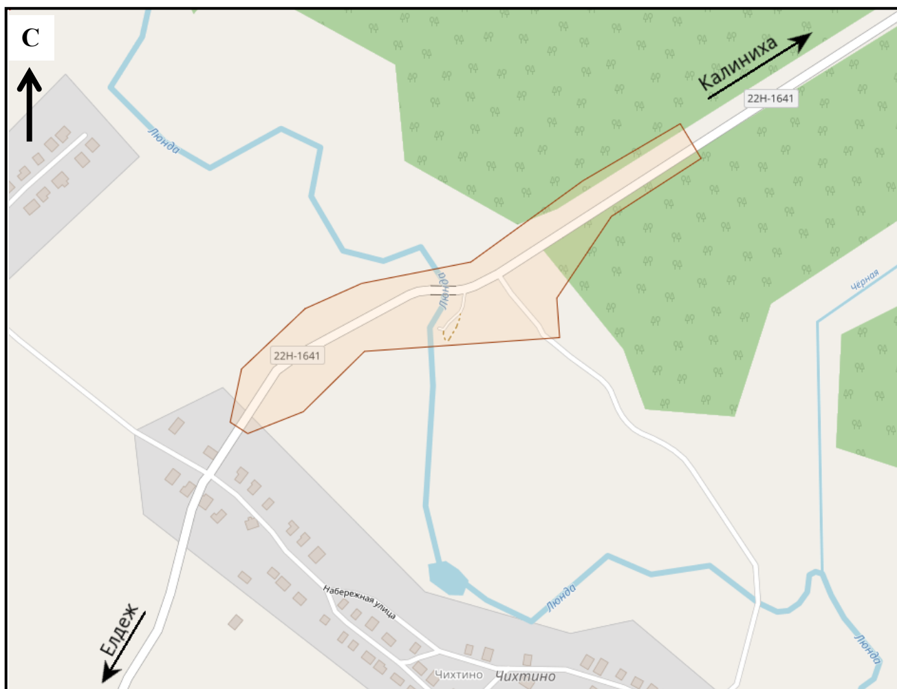
Схема границ подготовки документации по планировке территории (арх. № 113/22)