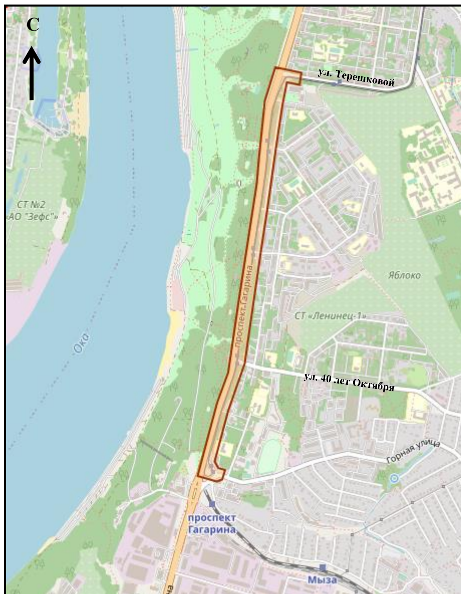
Схема границ подготовки документации по планировке территории (арх. № 158/22)