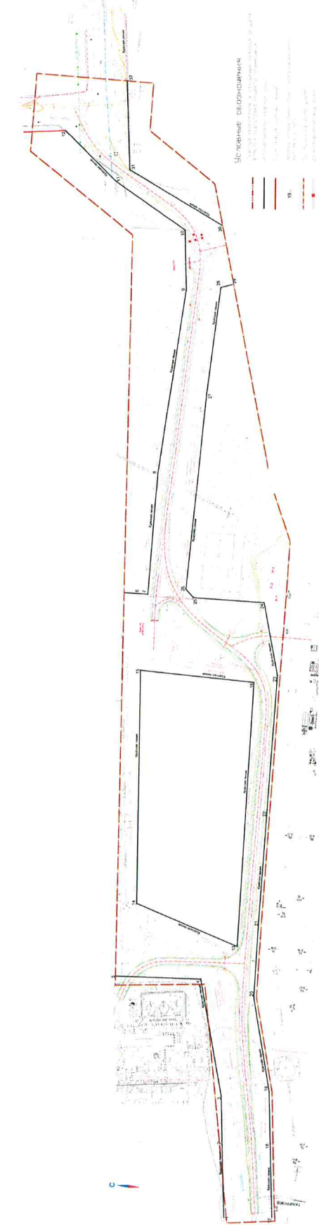
Перечень координат характерных точек красных линий Система координат местная, г. Дзержинск