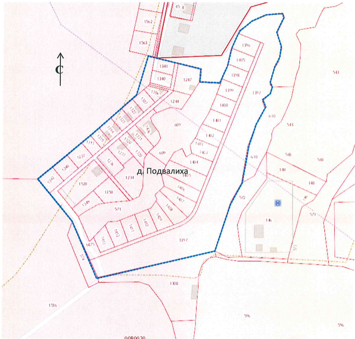
Схема границ подготовки документации по планировке территории (арх. № 38/19)