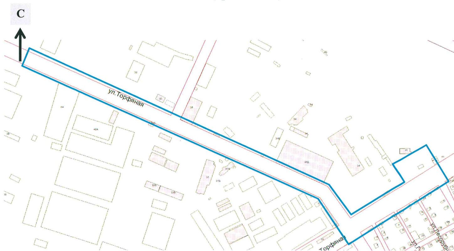
Схема границ подготовки документации по планировке территории (арх. №17/19)

ПРИЛОЖЕНИЕ к приказу департамента градостроительной деятельности развития агломераций Нижегородской области от 13 февраля 2019 г. №06-01-02/7