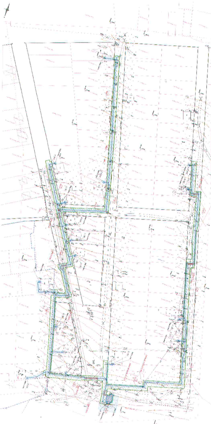
Каталог координат поворотных точек красных линий