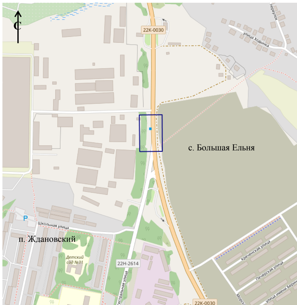
Схема границ подготовки документации по планировке территории (арх. № 117/22)