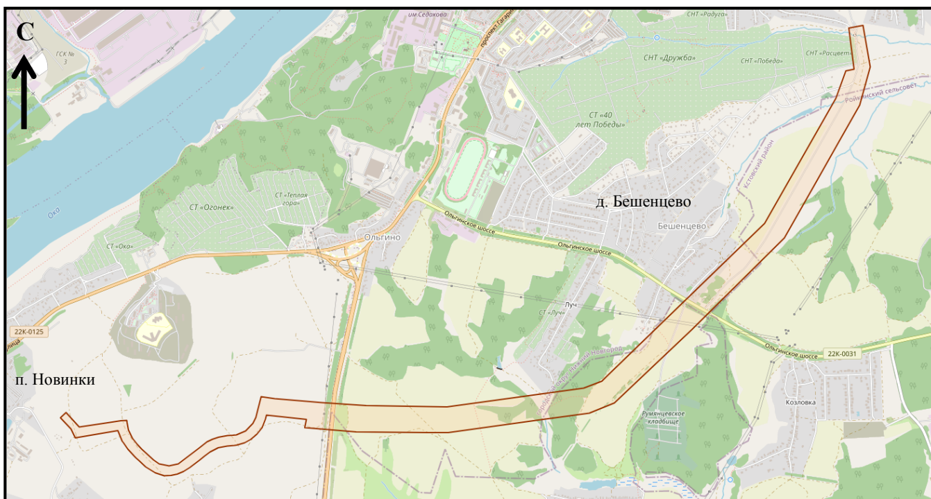
Схема границ подготовки документации по внесению изменений (арх. № 195/22)