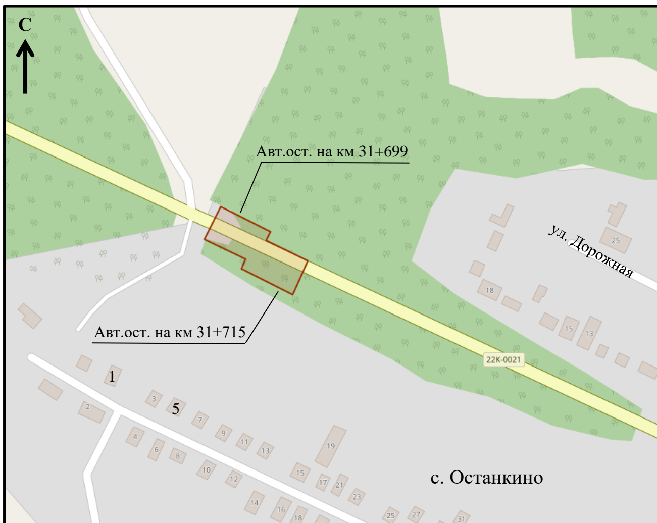
Схема границ подготовки документации по внесению изменений в документацию по планировке (проект межевания) территории (арх. № 206/22)