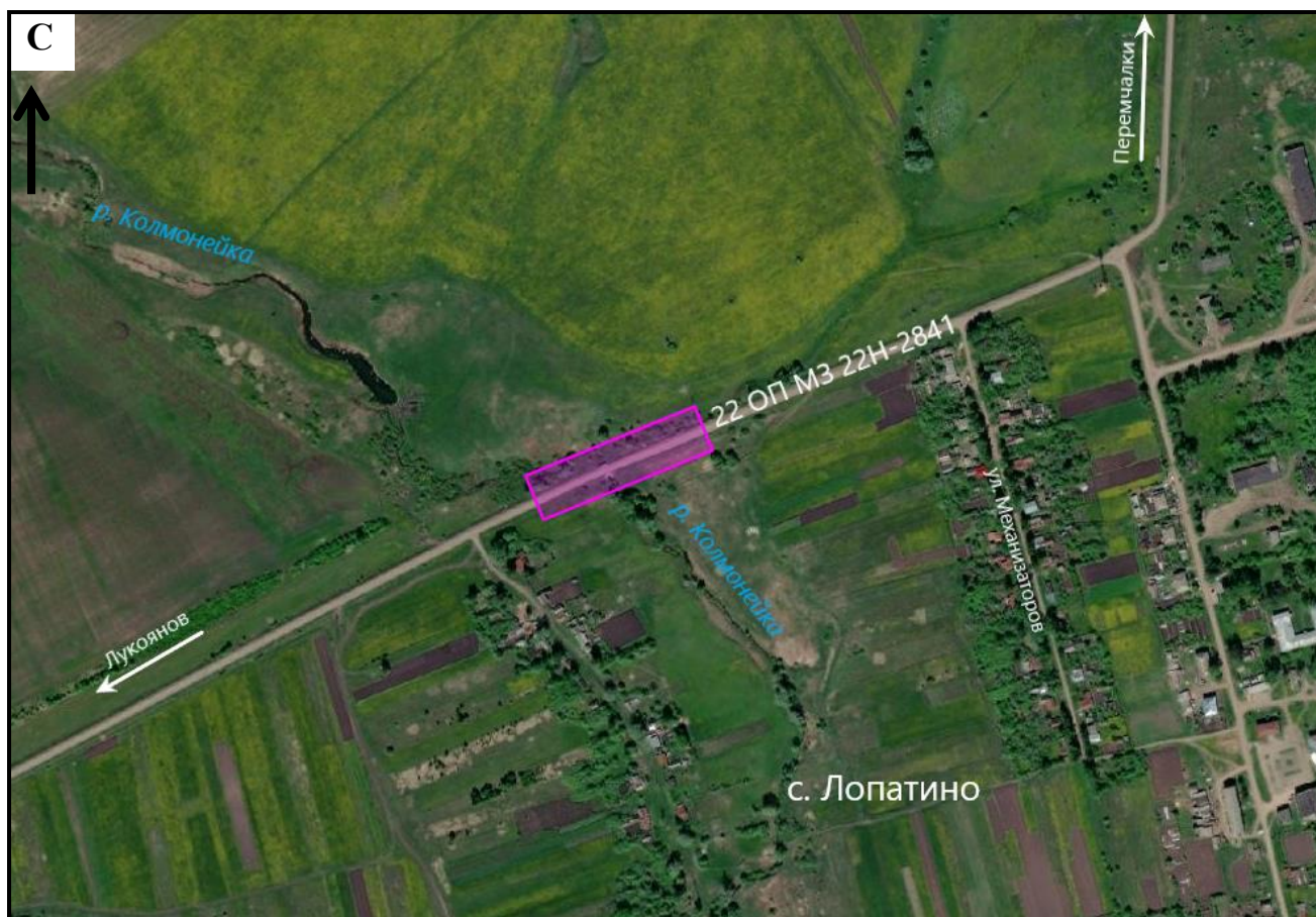
Схема границ подготовки документации по планировке территории (арх. № 213/22)