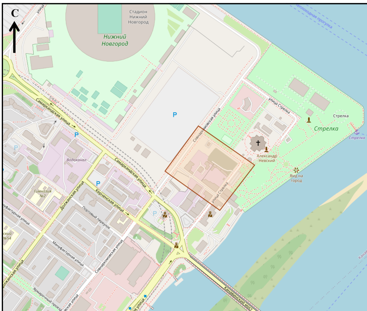
Схема границ подготовки документации по внесению изменений (арх. № 9/23)