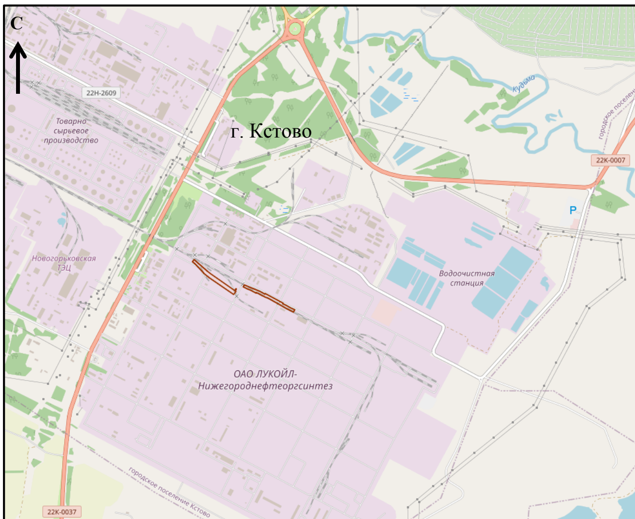
Схема границ подготовки проекта планировки территории (арх. № 8/23)