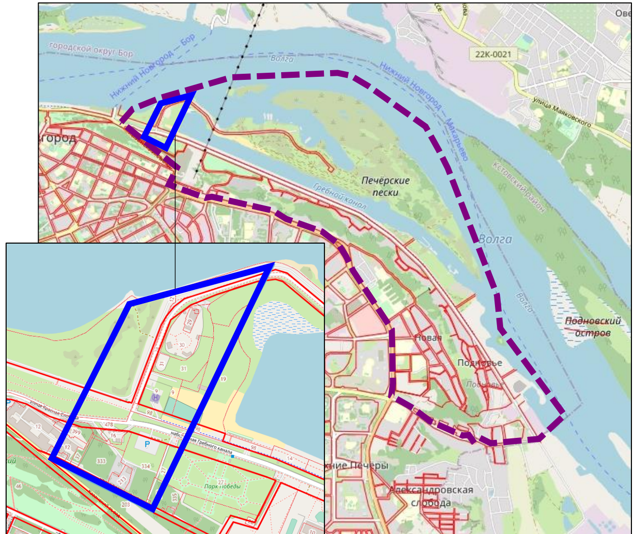
Схема границ подготовки документации по планировке территории