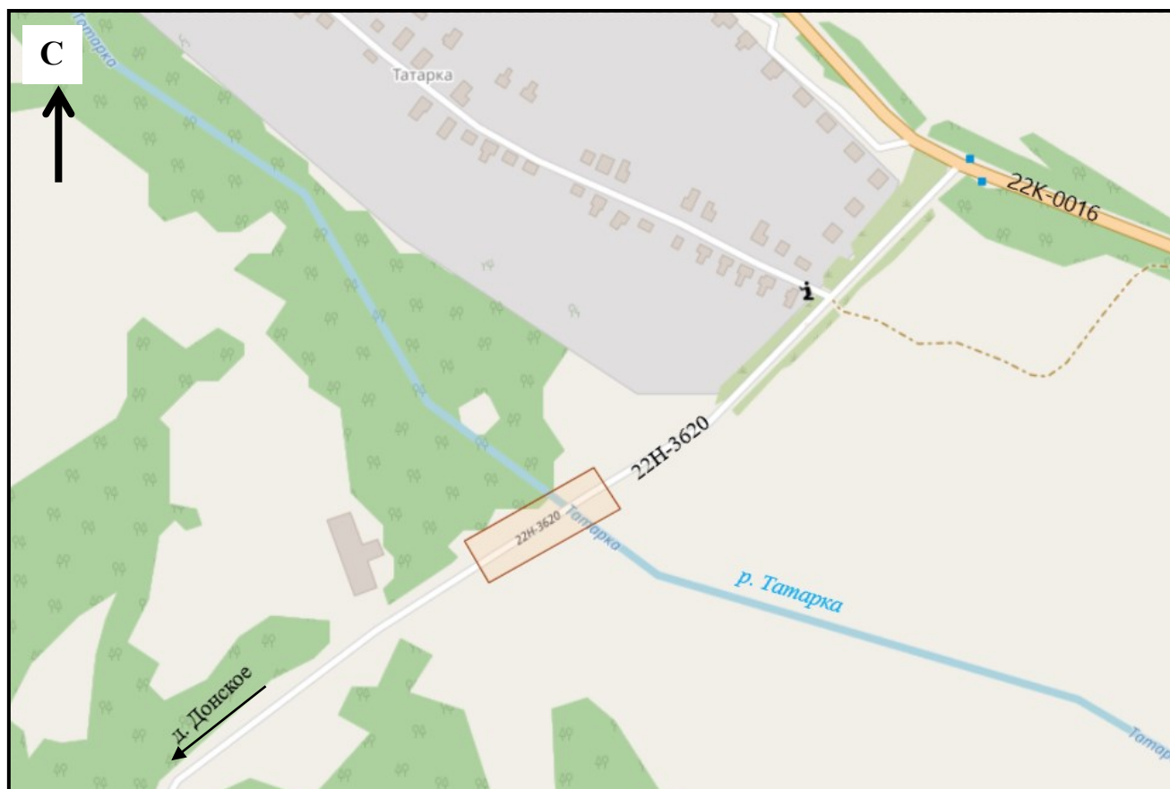
Схема границ подготовки документации по планировке территории (арх. № 14/23)