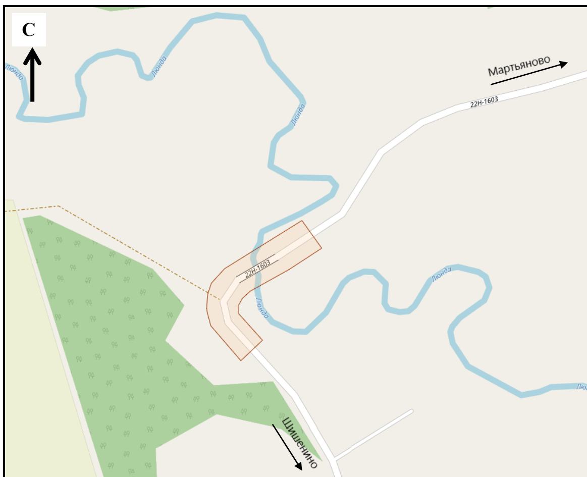
Схема границ подготовки документации по планировке территории (арх. № 21/23)