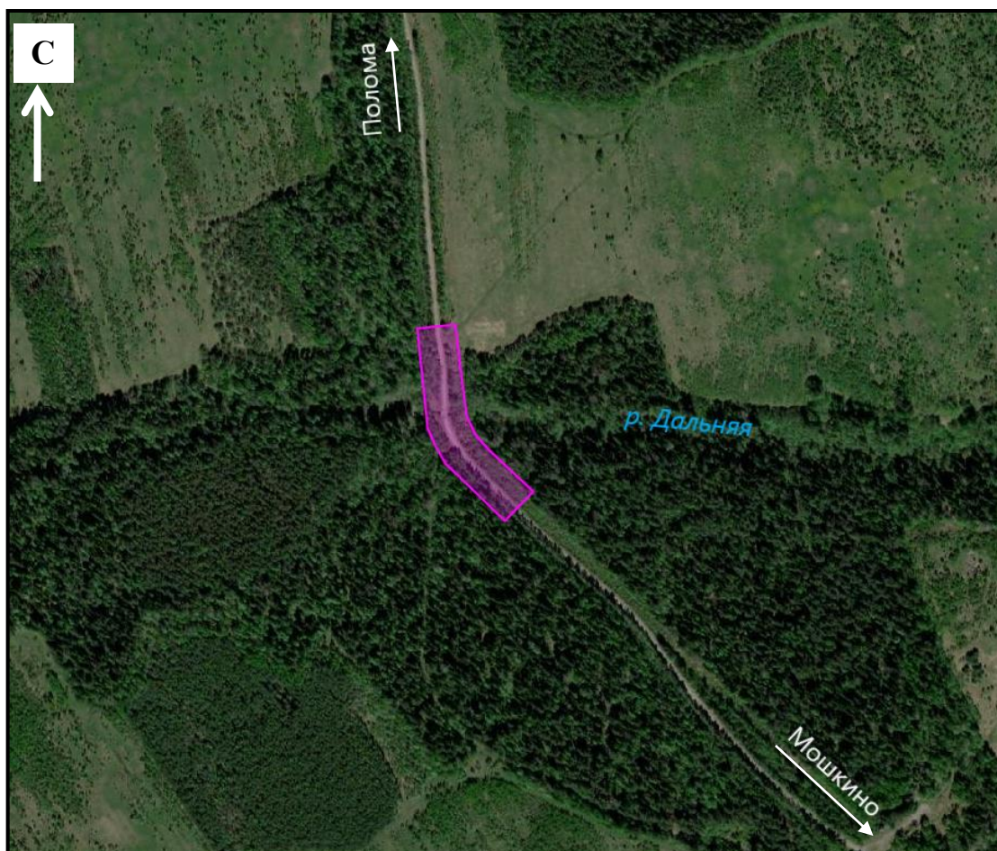
Схема границ подготовки документации по планировке территории (арх. № 28/23)